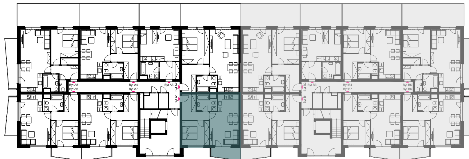
Schéma umístění bytu v objektu - 2.NP