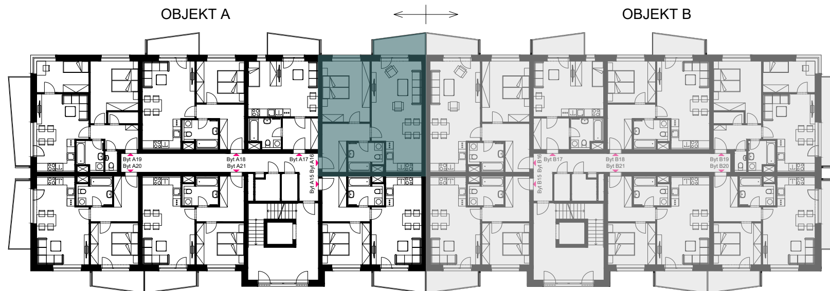
Schéma umístění bytu v objektu - 4.NP

Plochy jednotlivých místností jsou orientační. Vyobrazené zařízení ve schématech bytu (nábytek, kuch. linka, el. spotřebiče atd.) nejsou součástí dodávky. Rozsah dodávky je specifikován ve standardu. Investor si vyhrazuje právo na drobné úpravy.