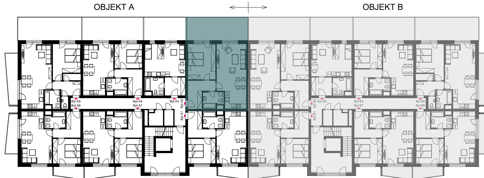
Schéma umístění bytu v objektu - 2.NP

Plochy jednotlivých místností jsou orientační. Vyobrazené zařízení ve schématech bytu (nábytek, kuch. linka, el. spotřebiče atd.) nejsou součástí dodávky. Rozsah dodávky je specifikován ve standardu. Investor si vyhrazuje právo na drobné úpravy.