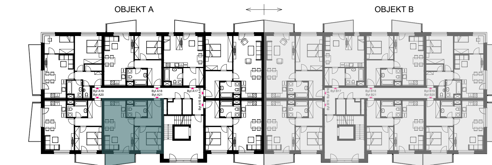
Schéma umístění bytu v objektu - 4.NP

Plochy jednotlivých místností jsou orientační. Vyobrazené zařízení ve schématech bytu (nábytek, kuch. linka, el. spotřebiče atd.) nejsou součástí dodávky. Rozsah dodávky je specifikován ve standardu. Investor si vyhrazuje právo na drobné úpravy.