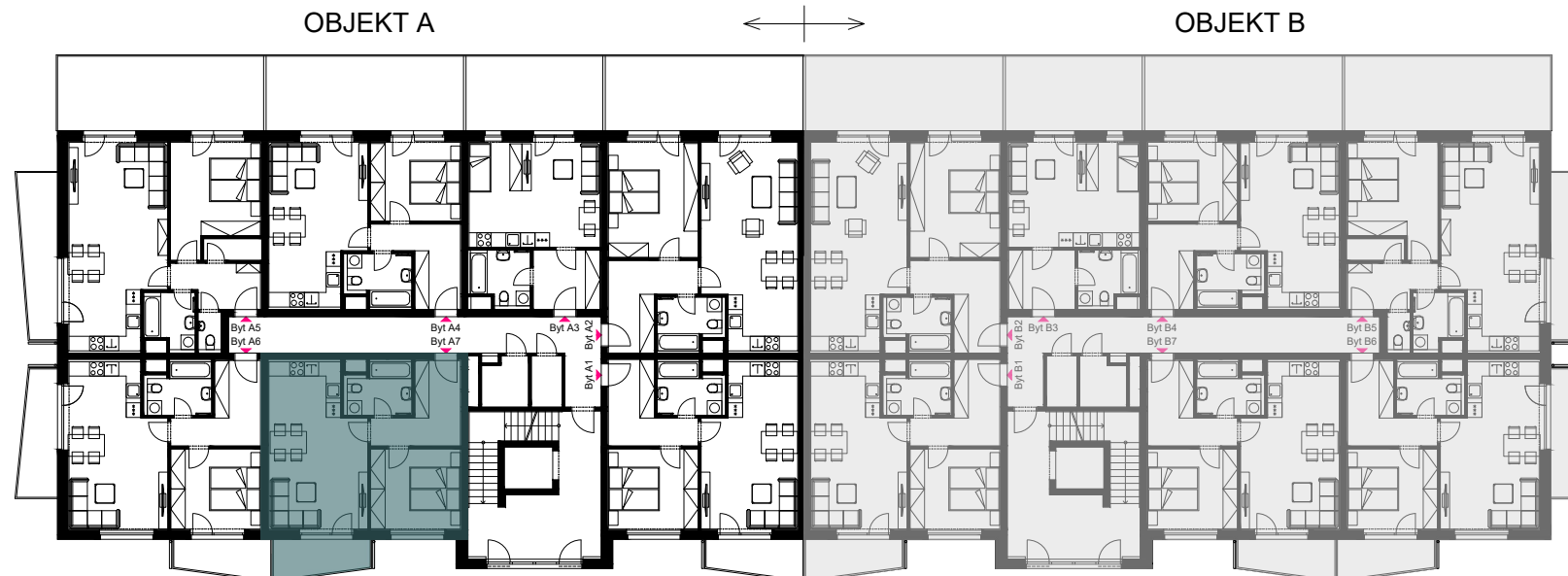
Schéma umístění bytu v objektu - 2.NP

Plochy jednotlivých místností jsou orientační. Vyobrazené zařízení ve schématech bytu (nábytek, kuch. linka, el. spotřebiče atd.) nejsou součástí dodávky. Rozsah dodávky je specifikován ve standardu. Investor si vyhrazuje právo na drobné úpravy.